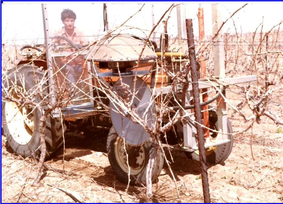
ענבי-יין. גיזום מכני (מכונה תוצרת בית) המפעיל ברוך רוזנסקי 1984